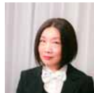
編曲・制作 鈴木まり

株式会社教育情報開発 piano-workshop 編 定価 2,800 円 + 消費税